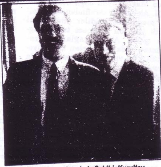
Megalomatis ve Dergimiz Sahibi, Kurultay sonrası yanyana.

Sayın Başkan, Değerli Meslektaşlarım, Bayanlar ve Baylar,