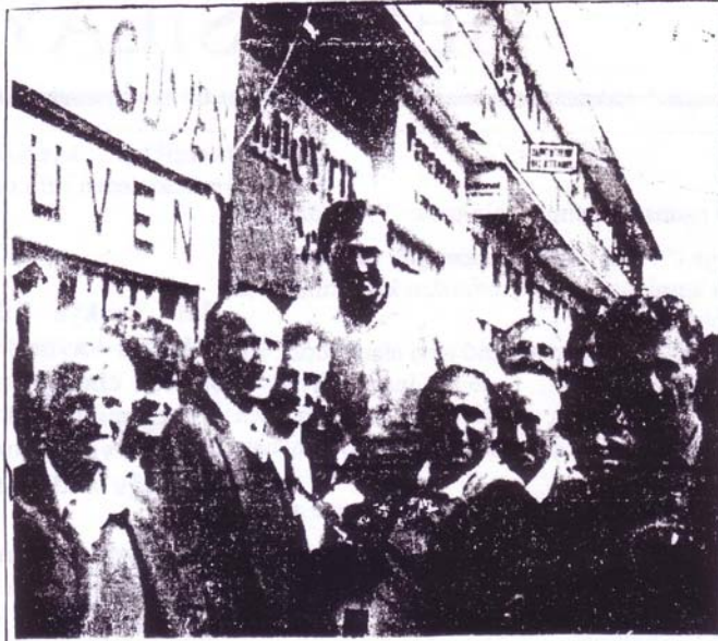
Şimdi de gönülllerimizde yaşayacak...

Rahmetle andığımız Sadık Ahmet'i 1977 yılında tanıdım. O yıllar Trakya Türkü'nün lidersiz, başsız kaldığı yıllardı.