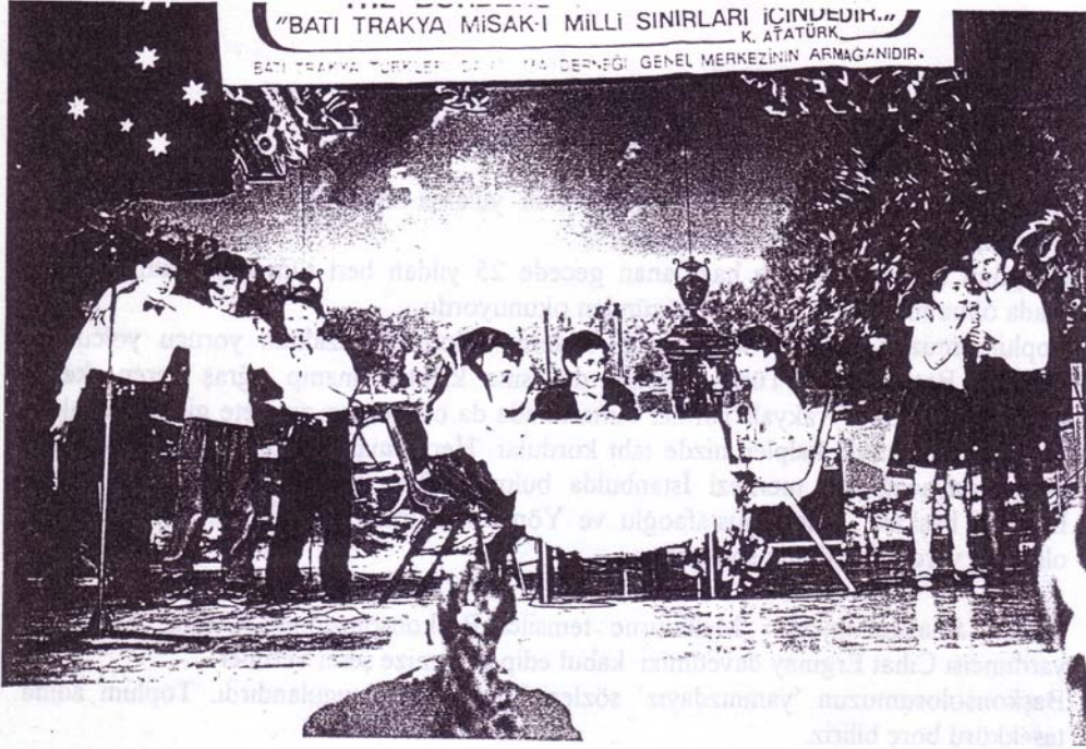
13 Ocakta yapılan 25. Lİ YIL kutlamalarında "İle Bizim Çocuklarımız" adlı oyundan bir sahne