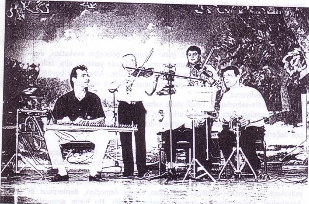
Yine aynı gecede bize deyasıya türk sanat müziğini dinleme imkânı sağlayan müzik gurubumuz