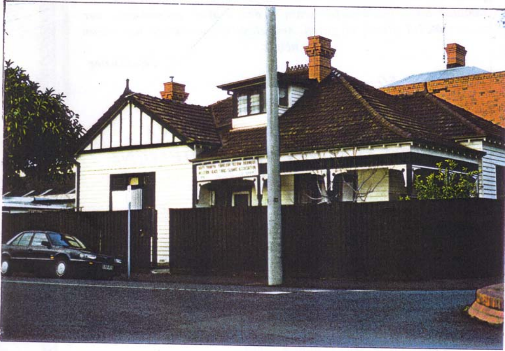
Çeyrek asırdan beri Batı Trakya Türklerinin her türlü ihtiyaçlarına cevap vermeğe çalışan dernek binası.

KASIM- ARALIK- OCAK- ŞUBAT- MART 1996- 97