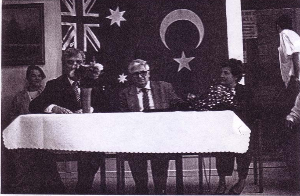
Soldan sağa: Melburne B.Konsolosu Cengiz Sanay T.C. Kanbera Büyükelçisi Bilâl Şimşir ve eşi Sayın Gülgün Şimşir

T.C. Kanbera Büyükelçisi Sayın Bilâl Şimşir 2/ 11/ 96 tarihinde Melburne gezisi sırasında Batı Trakya'lı soydaşlarının da derneklerinde ziyaret etti. Bu ziyaret esnasında halkın bazı sorularını da yanıtlayan Şimşir, halktan da aktif ve ileri bir toplum olmak için daha fazla çaba sarfetmelerini istedi.