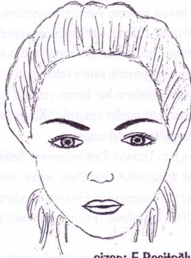
çizen: F. Reşitoğlu

Yanak bölgesi, ciğerlerinizin sağlığını gösterir. yanaklardaki kızarıklık ve kaşıntılar soğuk algınlığında ve göğüs enfeksiyonlarında ortaya çıkabilir. Eğer ciğerleriniz güçsüz ise iltihaplarda oluşabilir. Sigara içmek cildi çok çabuk yaşlandırır ve yüzün bu bölgesi özellikle, yaşlanmaya daha meyillidir.