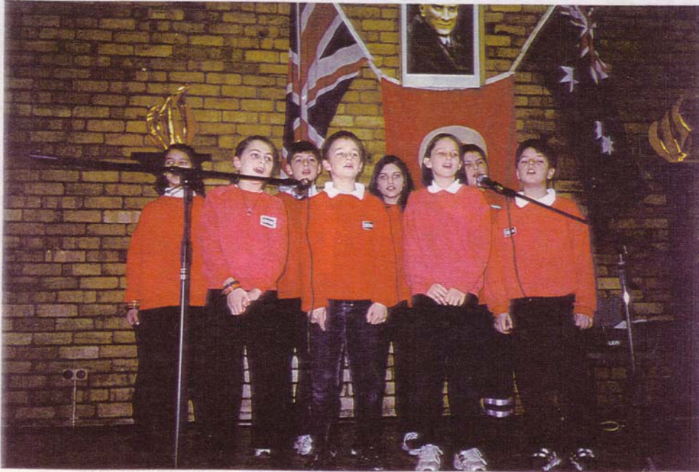
B.T.T. Okulu Beşinci sınıf öğrencileri "Yolculuk Var" şarkısını söylerken.